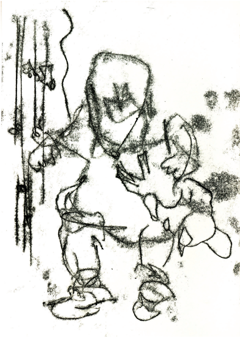
29 B B Bambi , 2022. Silkscreen ink on paper. 21 x 29.7 cm / 8.3 x 11.7 in