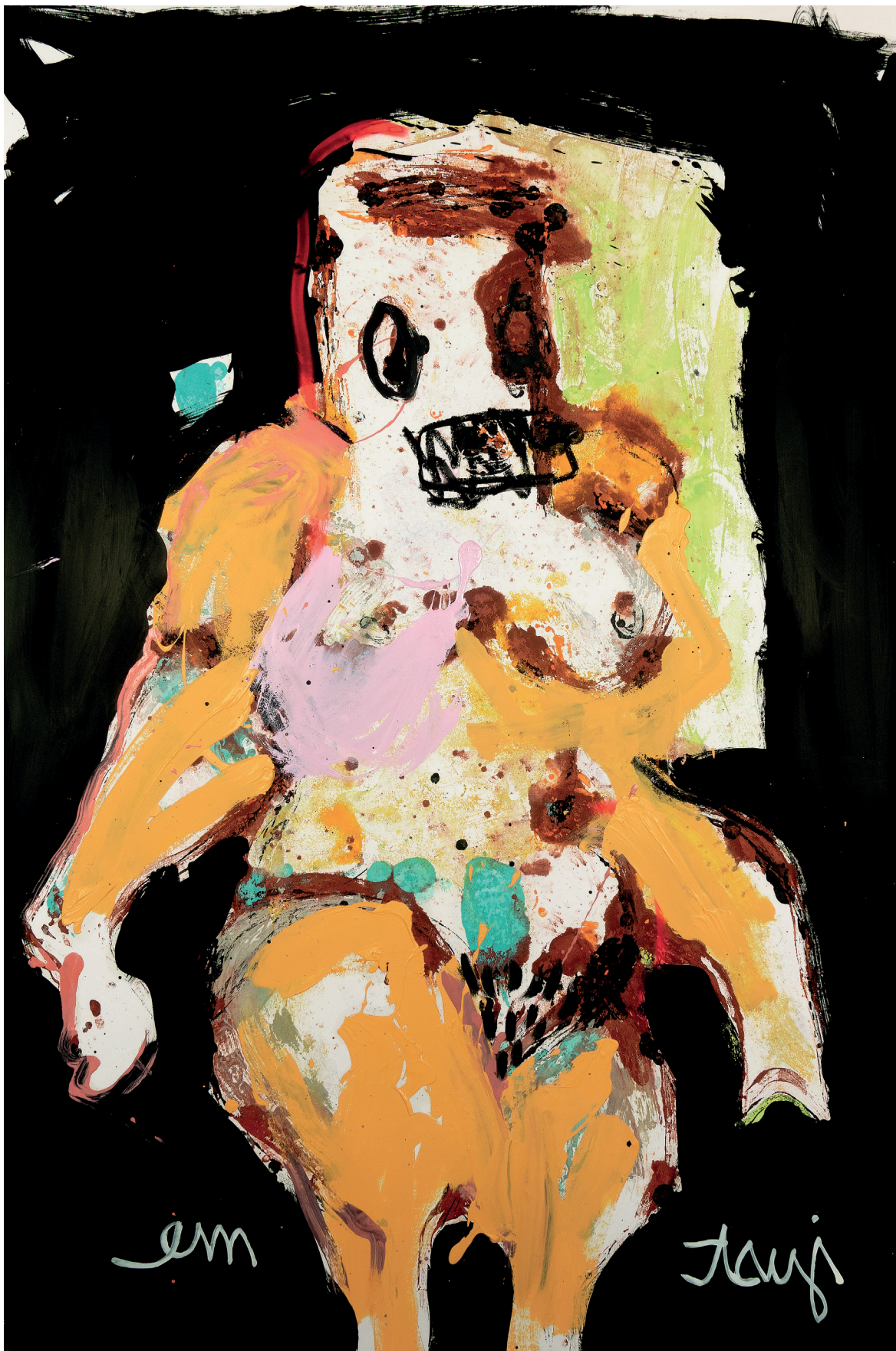
13 Just me , 2023. Oil, spray paint, felt and crayon on paper mounted on on canvas. 80 x 120 cm / 31.5 x 47.2 in