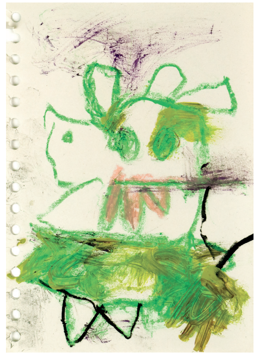
3 Sexy Hippopotamus , 2023. Oil and crayon on paper. 14.8 x 21 cm / 5.8 x 8.3 in