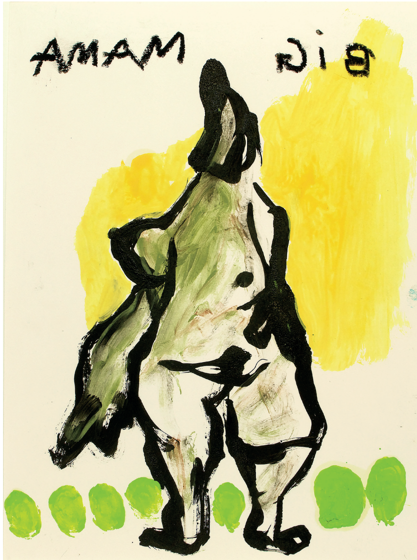
2 Big Mama , 2022. Oil and crayon on paper. 24 x 32 cm / 9.5 x 12.6 in