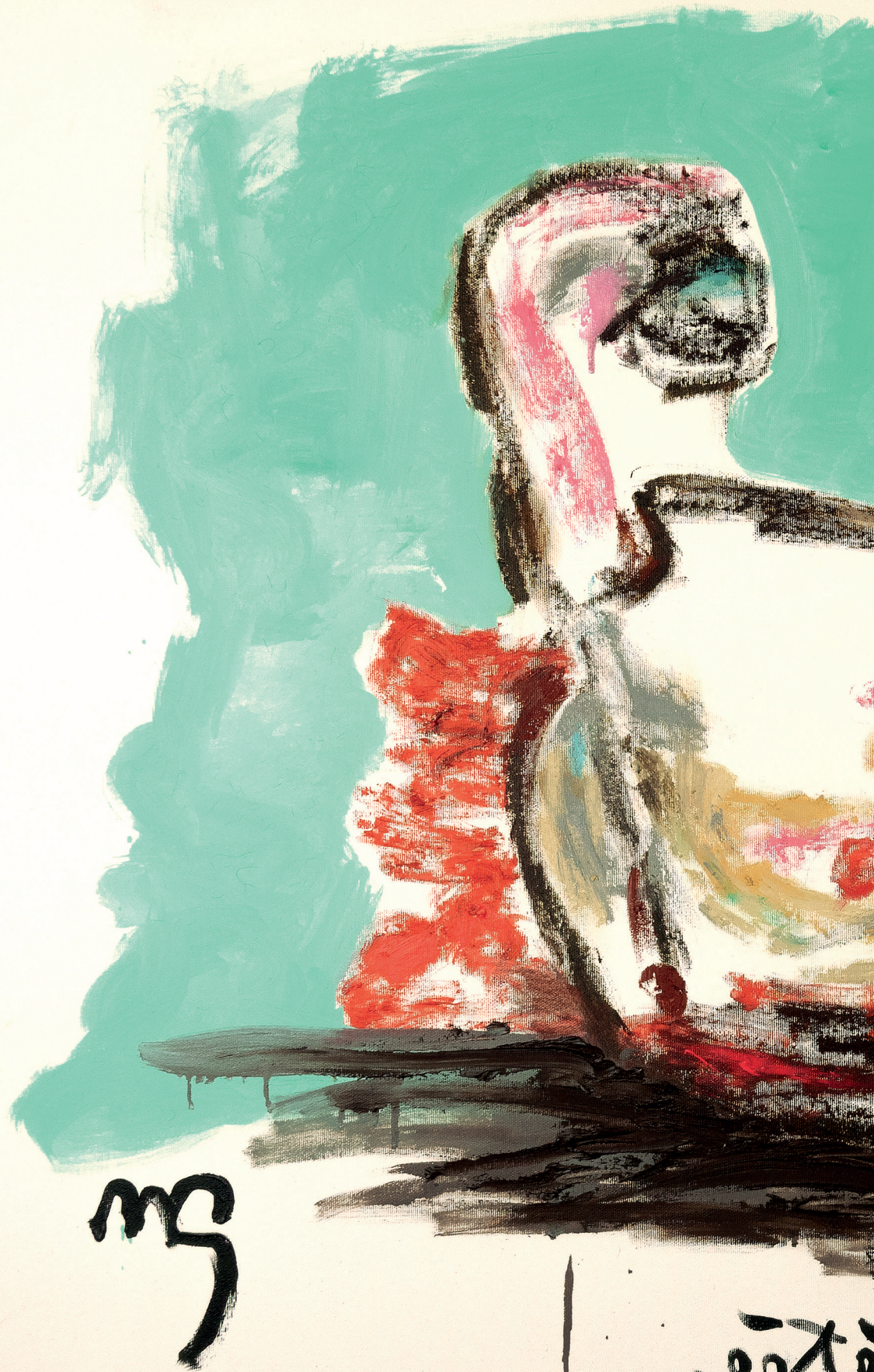
12 Dernière tétée , 2022. Oil and oil stick on canvas. 116 x 89 cm / 45.7 x 35 in