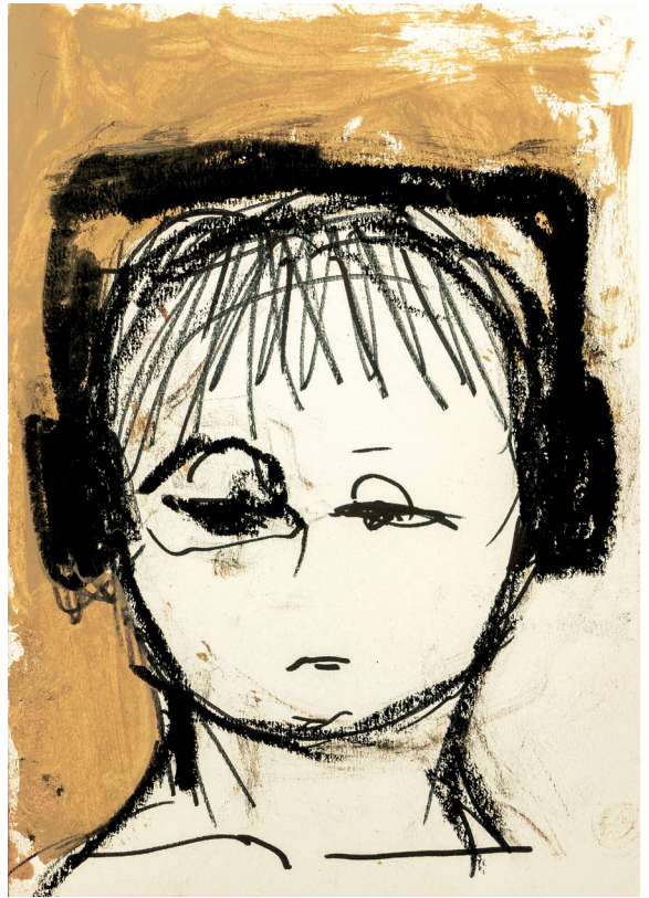
1 Don't listen to me, 2022. Oil, oil stick and felt on paper. 14.8 x 21 cm / 5.8 x 8.3 in