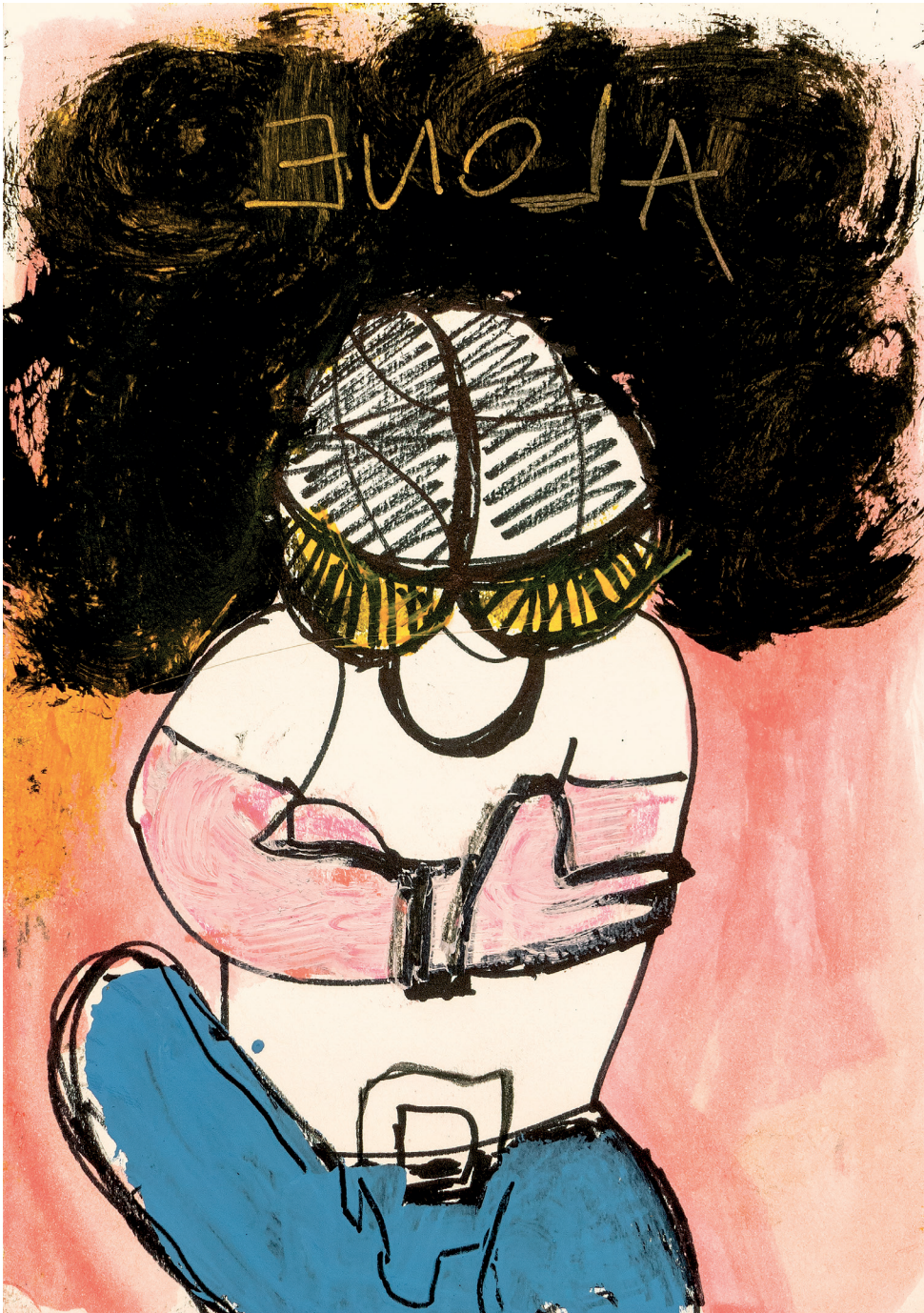
33 Alone , 2022. Oil, felt and oil stick on paper. 14.8 x 21 cm / 5.8 x 8.3 in