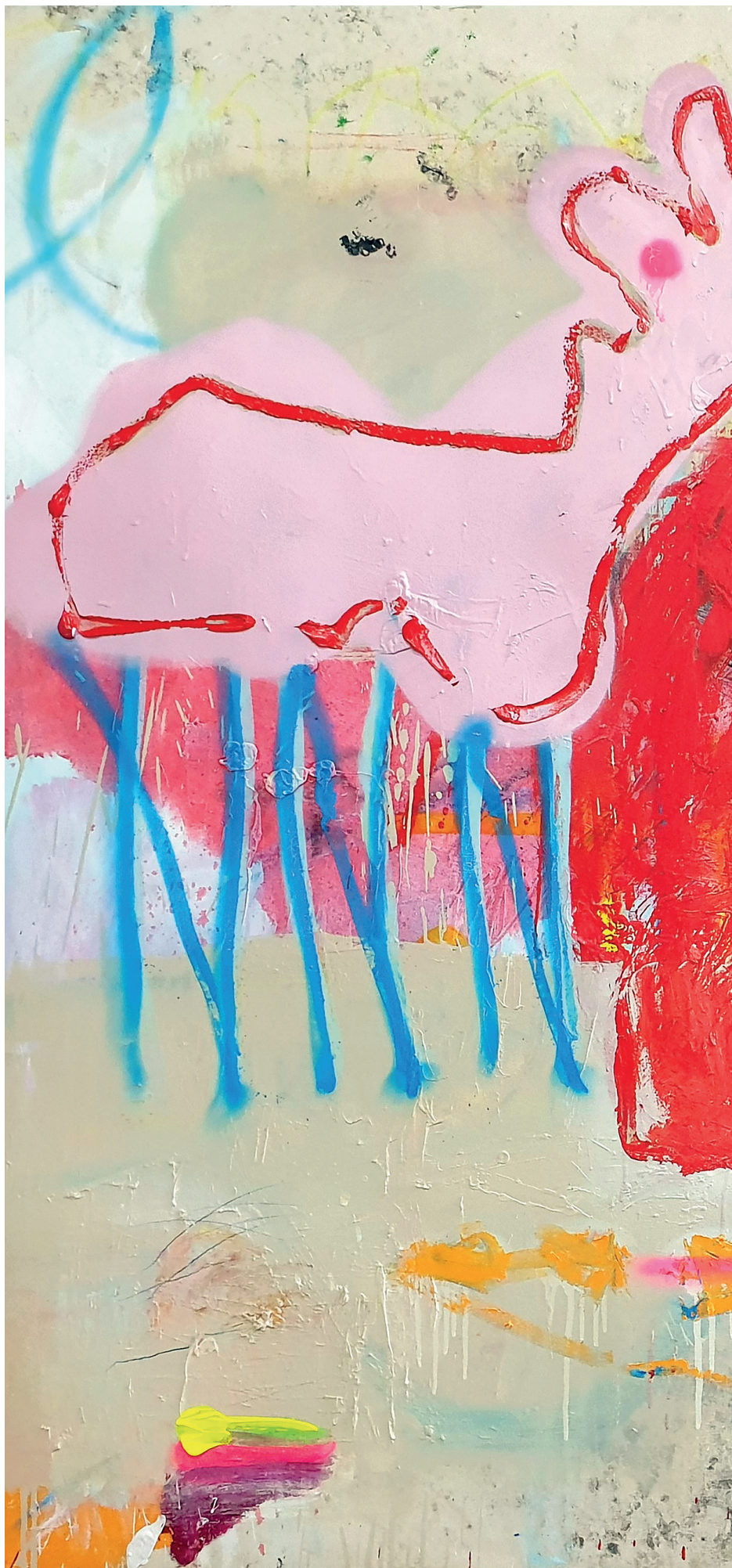
9 Your letter, 2021. Oil, oil stick, spray paint and crayon on canvas. 162 x 130 cm / 63.8 x 51.2 in