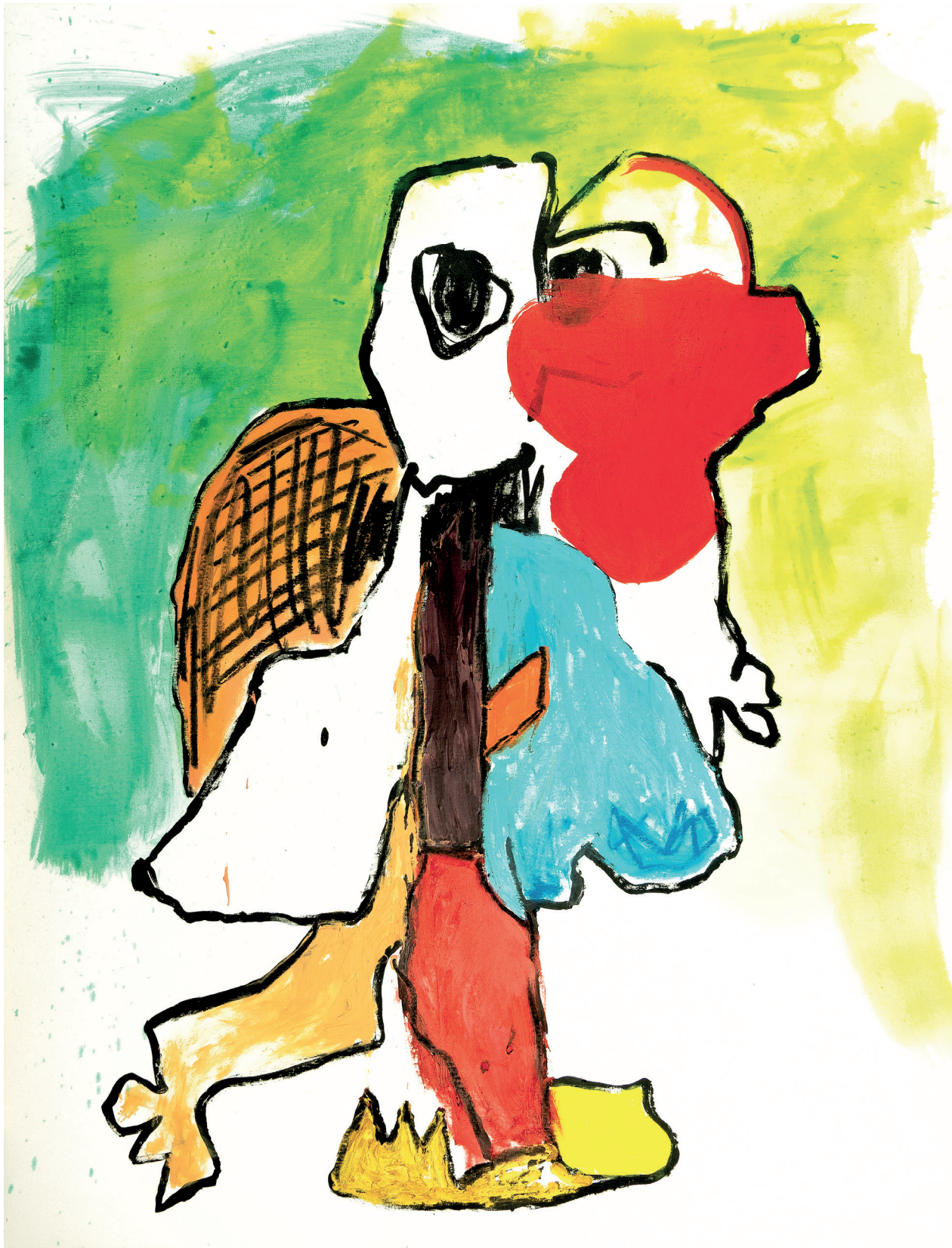
26 Walking , 2023. Oil and oil stick on canvas. 89 x 116 cm / 35 x 45.7 in