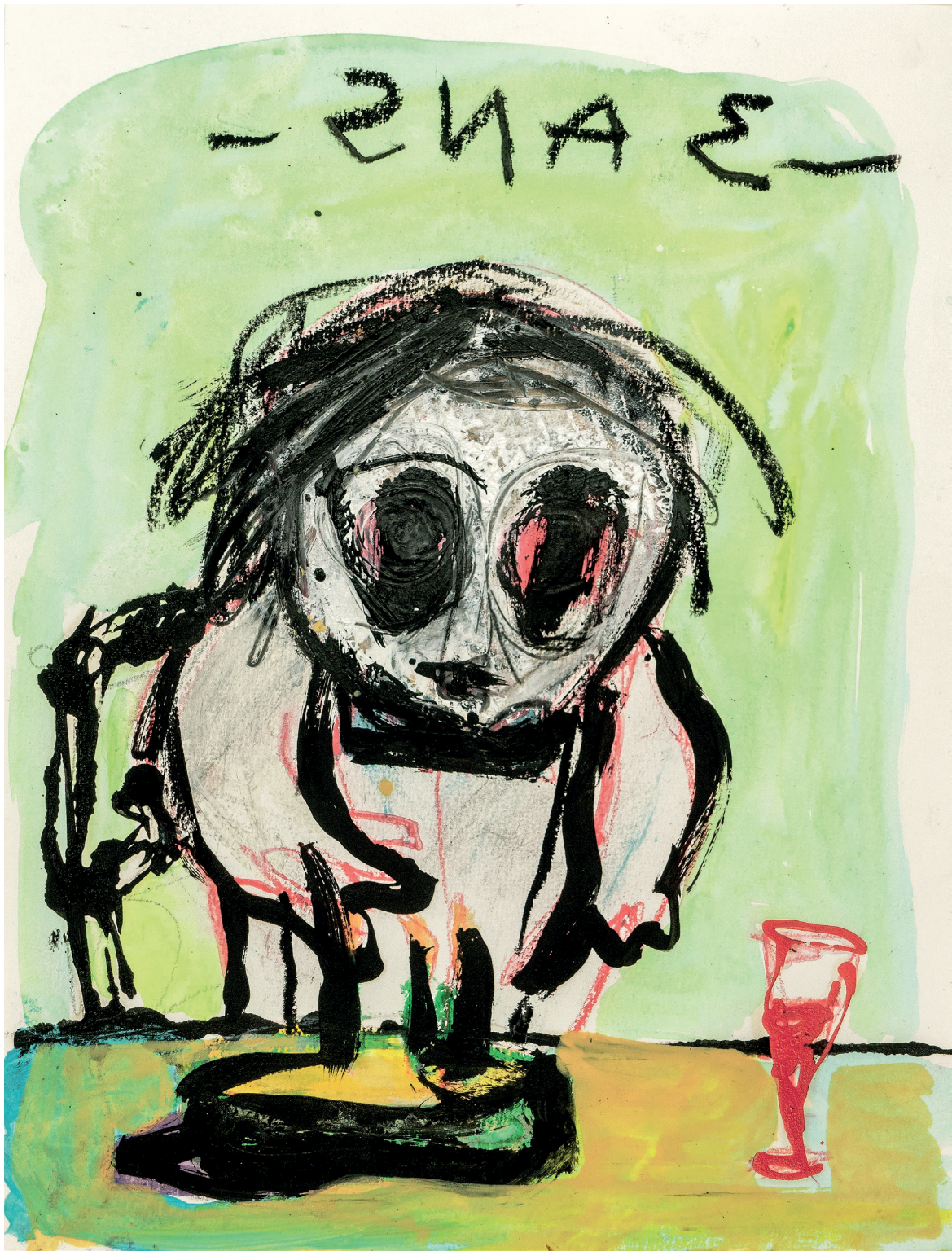
5 3 ans , 2022. Oil, pencil and crayon on paper. 24 x 32 cm / 9.5 x 12.6 in