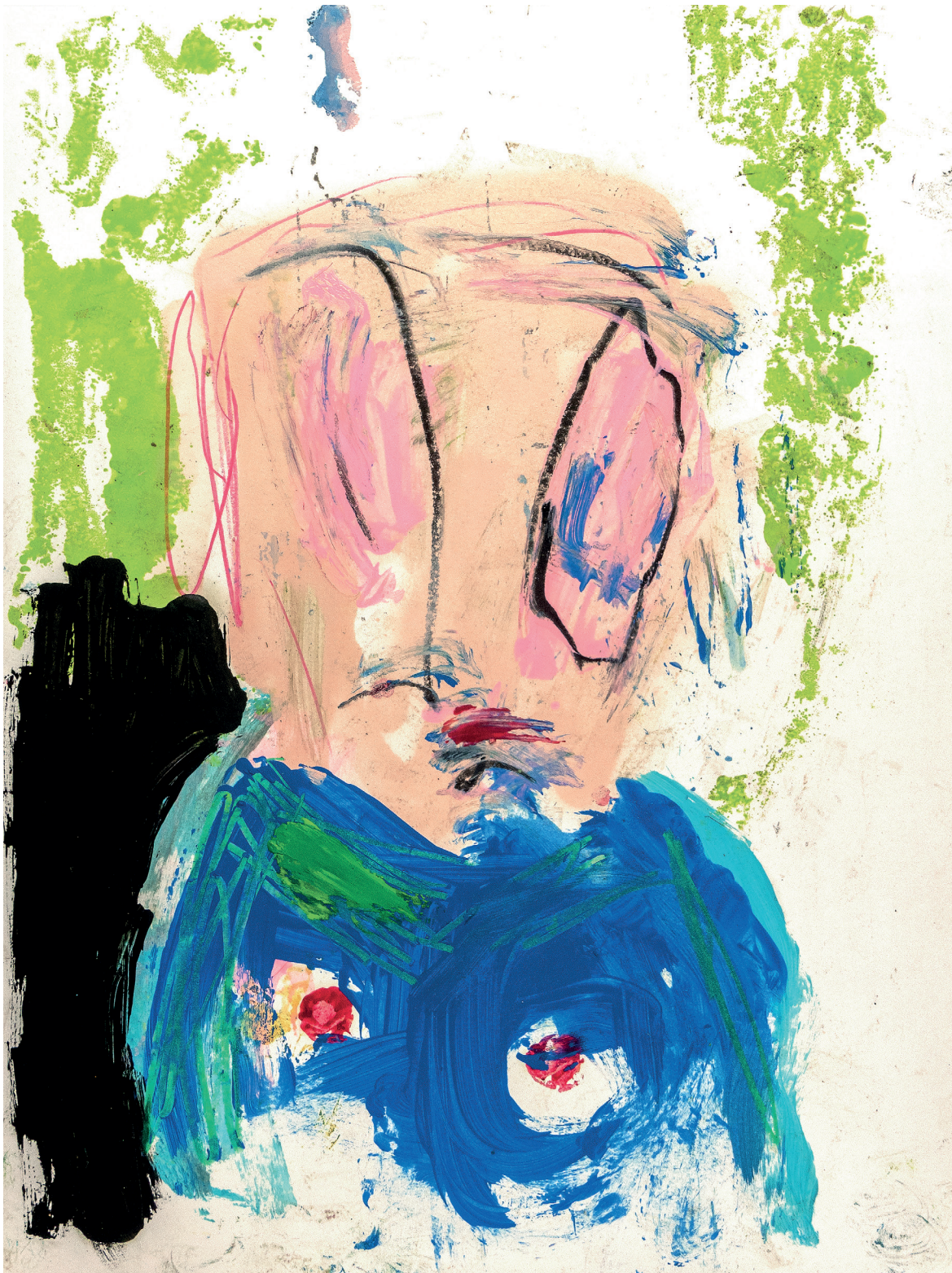
10 Autoportrait bleu , 2022. Oil, pencil and crayon on paper. 24 x 32 cm / 9.5 x 12.6 in