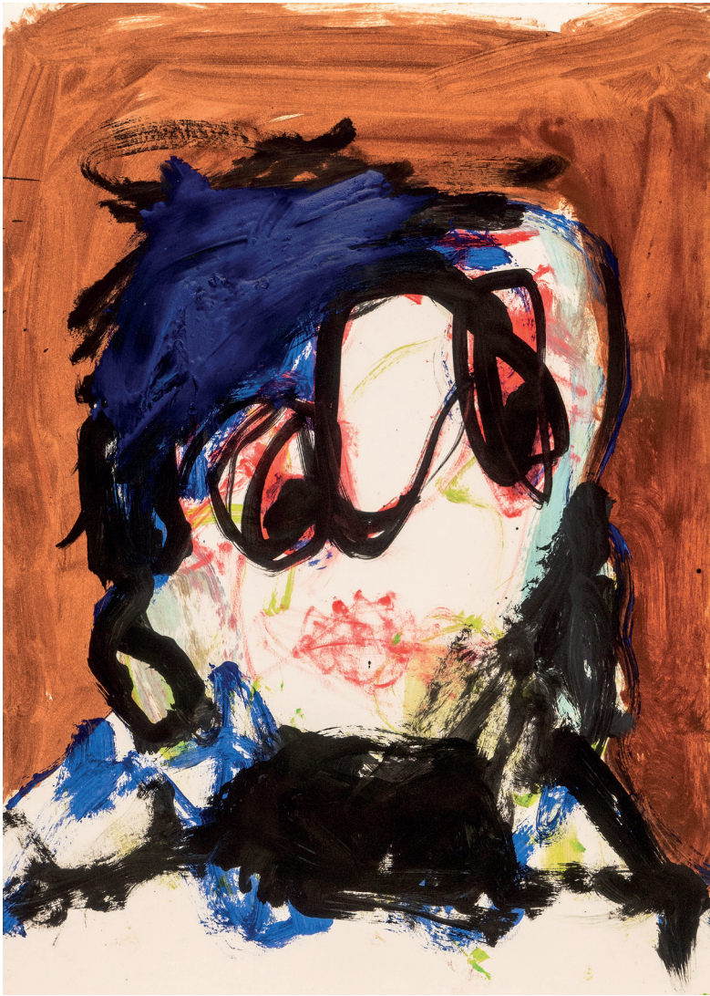
24 Autoportrait , 2023. Oil on paper . 29.7 x 42 cm / 11.7 x 16.5 in