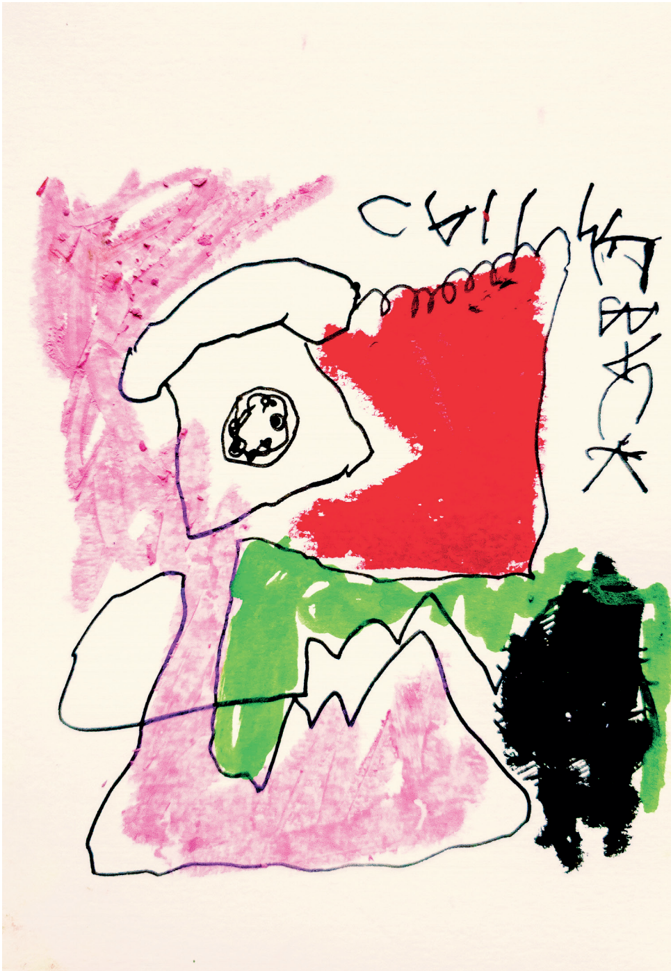
37 Call me back , 2021. Felt, marker and oil stick on paper. 14.8 x 21 cm / 5.8 x 8.3 in

+33 6 89 77 60 33 @natalygoubet www.natalygoubet.com