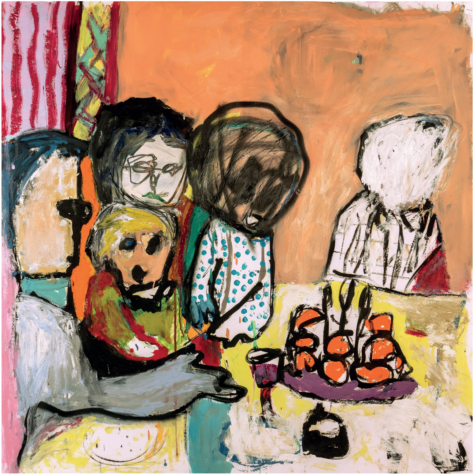
19 Dîner de famille , 2022.

Oil, oil stick, spray paint and pencil on paper mounted on canvas.