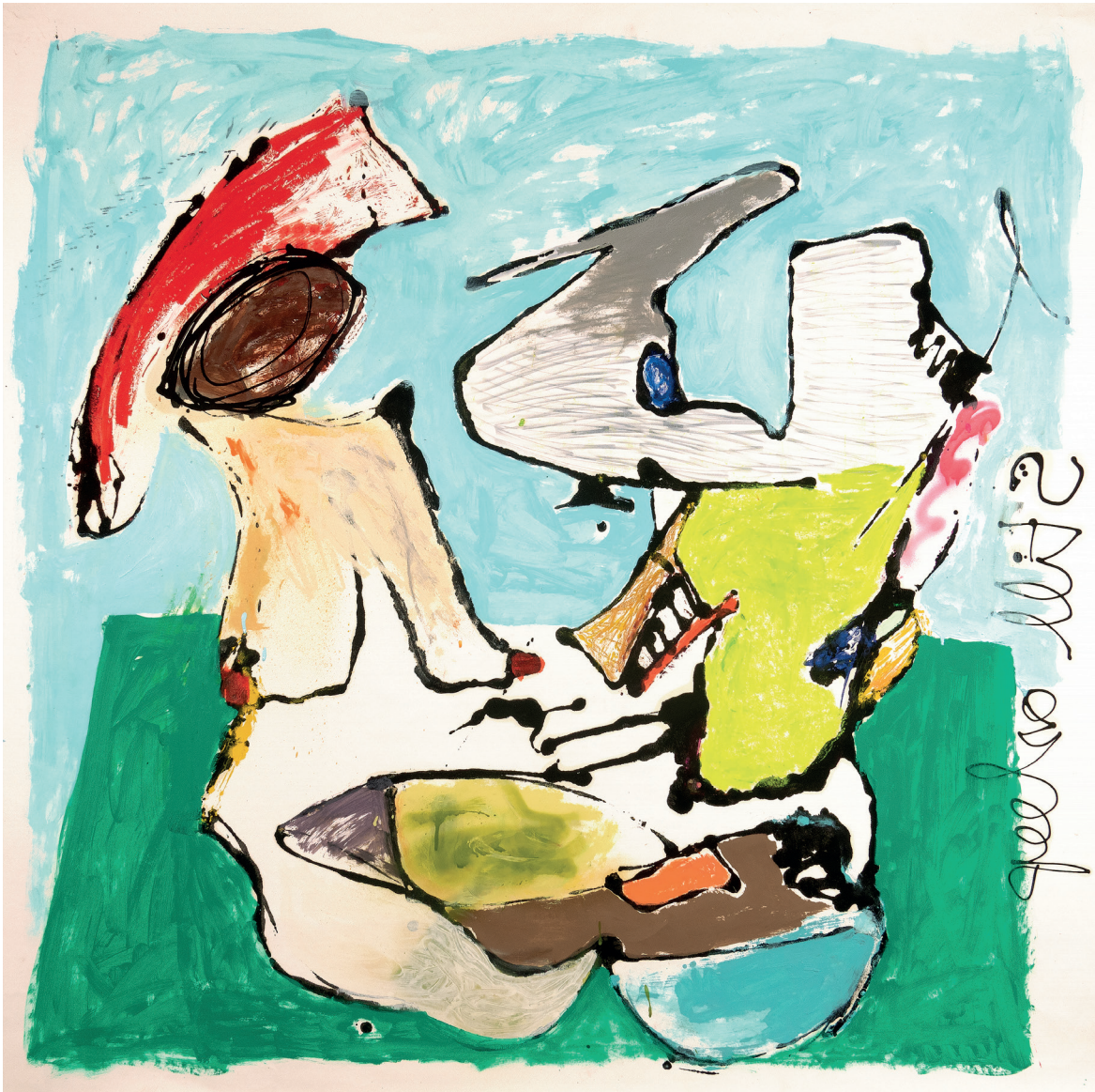
31 Still asleep , 2022. Oil, oil stick, acrylic and spray paint on paper mounted on canvas. 120 x 120 cm / 47.2 x 47.2 in