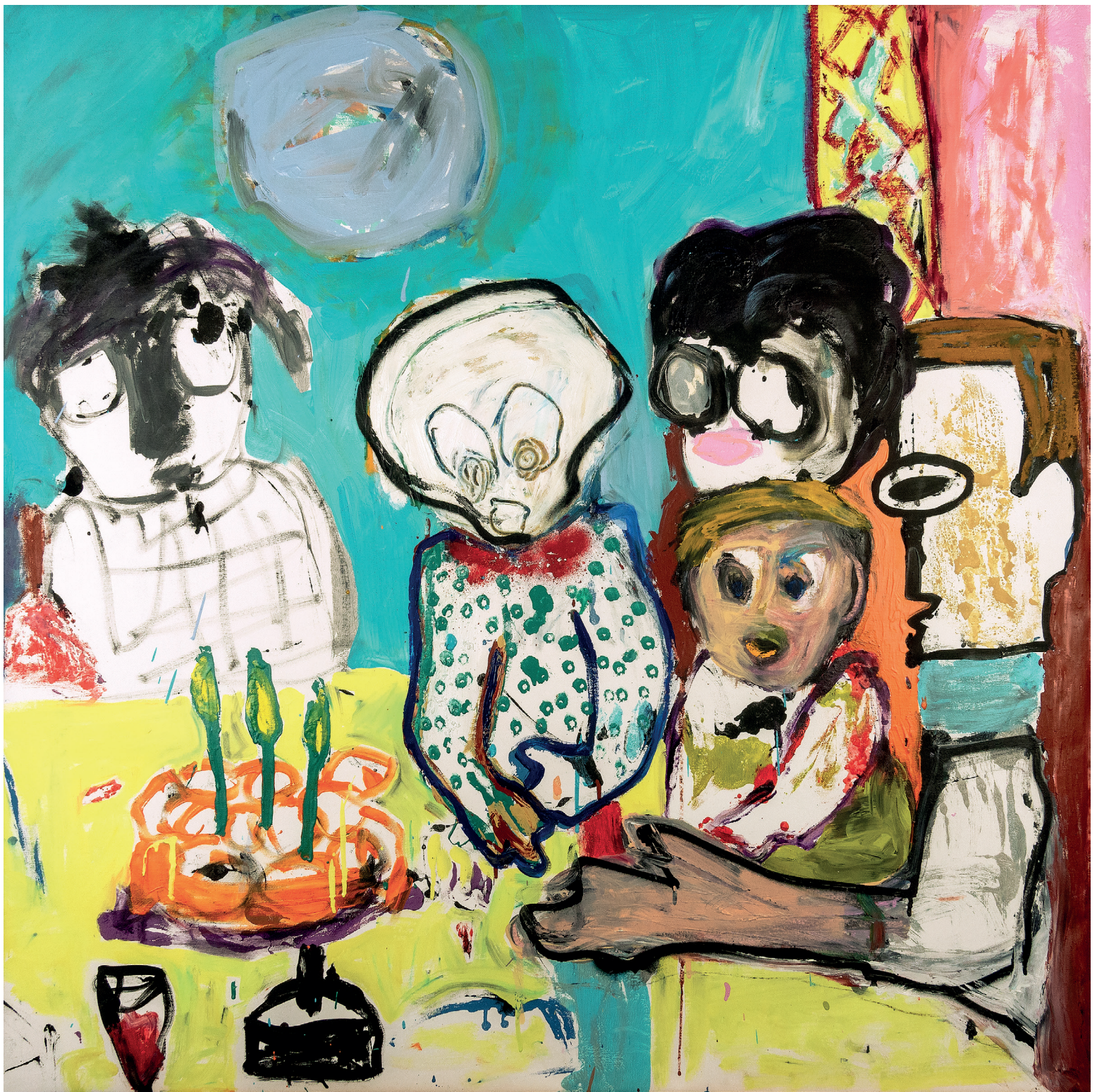
20 Dîner de famille , 2022 . Oil, oil stick, spray paint and pencil on canvas. 100 x 100 cm / 39.4 x 39.4 in