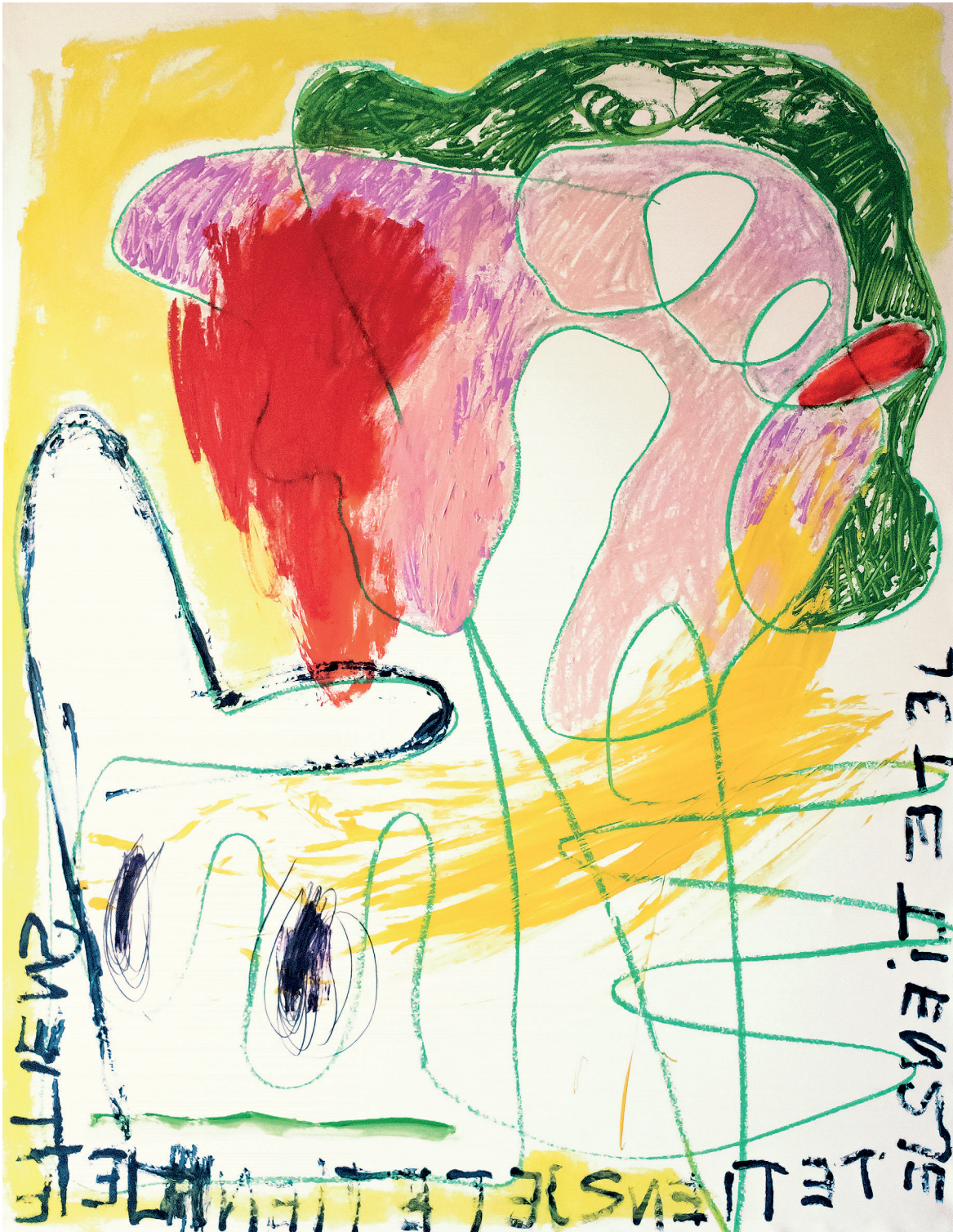
15 Je te tiens , 2021. Oil, oil stick and pencil on paper mounted on canvas. 114 x 146 cm / 44.9 x 57.5 in