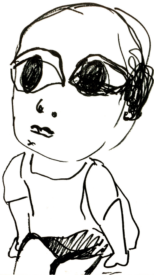
35 I was like a doll , 2022. Felt on paper. 14.8 x 21 cm / 5.8 x 8.3 in