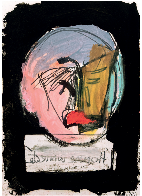
7 L'origine du monde , 2023. Oil, oil stick and spray paint on paper mounted on canvas. 80 x 120 cm / 31.5 x 47.2 in