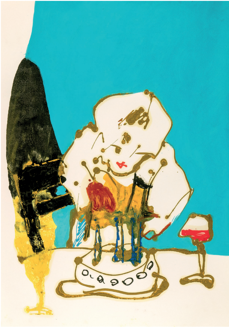
21 3 ans , 2022. Oil on paper. 43 x 61 cm / 16.9 x 24 in