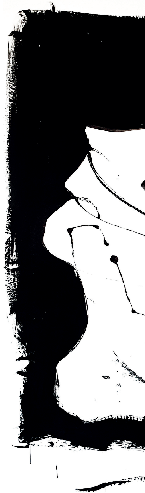
23 Tell me, 2022. Oil on paper mounted on canvas. 150 x 150 cm / 59 x 59 in