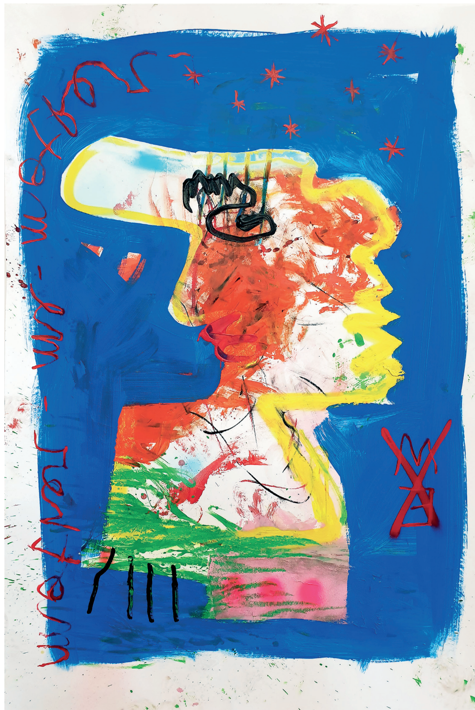
17 I just want 2 B myself , 2021. Oil, marker, crayon, wipe and spray paint on paper mounted on canvas. 114 x 146 cm / 44.9 x 57.5 in